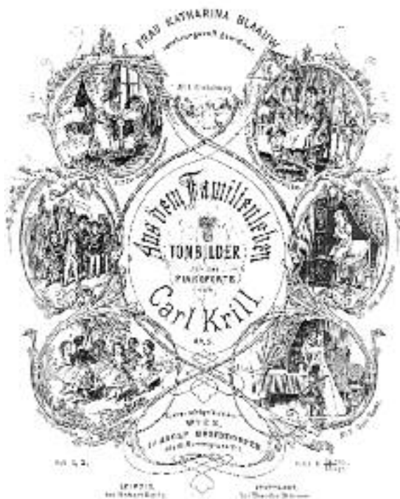
Carl Krill. Aus dem Familienleben . 7 Tonbilder für das Pianoforte, opus 5, Wien, bei Adolf Bösendorfer. Omslagpagina.

‘helderheid’. Tegelijkertijd heeft het gehele album wel een ‘goede strekking’, en de uitgave wordt als ‘zeer bevredigend’ gezien 7 .