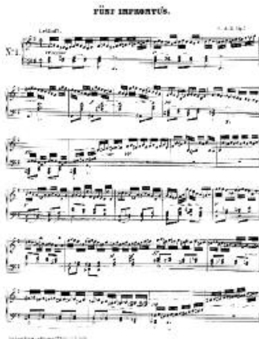
Nr. 1 uit Fünf Impromptu's, opus 1, 1868.