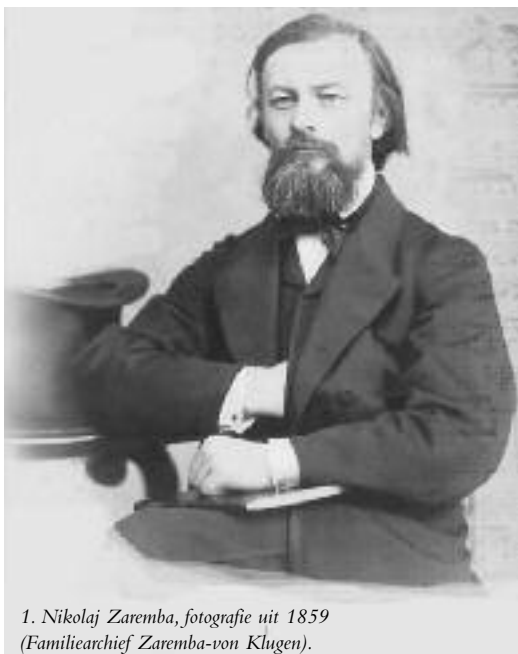
1. Nikolaj Zaremba, fotografie uit 1859 (Familiearchief Zaremba-von Klugen).

Vergeten door musicologen gedurende meer dan een eeuw, kwam Nikolaj Zaremba weer in de belangstelling naar aanleiding van de opening van de archieven van het Conservatorium in St. Peterburg. De jonge onderzoeker Andrei Alexejev-Boretski verzette bergen werk om het familie-archief en de Zarembanazaten via Internet in Nederland (de dochter van Zaremba Lydia trouwde in 1891 met de latere Nederlandse premier Theodorus Heemskerk), Zwitserland en Amerika op te sporen. Nadat tientallen manuscripten met nog nooit uitgevoerde orkest-, koor- en pianocomposities in Basel werden gevonden, lukte het Alexejev-Boretski om binnen één jaar een familiereünie én een