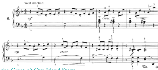
Lesly Fly – Alfred the Great uit Our Island Story .

leven van kinderkamers, dat onvermijdelijk het onderwerp van albums werd. Maar juist dergelijke thematische cycli gaan in de twintigste eeuw de neutraal klinkende bundels als Kinderstukken vervangen. Niet alleen de titels van de miniaturen, ook de albumtitel moest tot de verbeelding spreken. Een voorbeeld is het heel eenvoudig gecomponeerde, educatieve en onderhoudende Our island story (1925) van Fly.